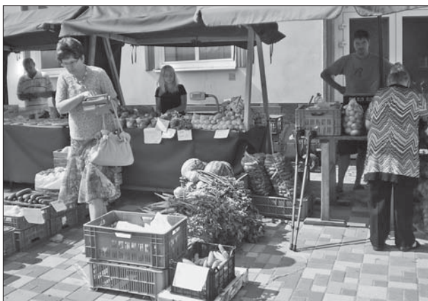
Podzim na Farmářských trzích

V minulém čísle Zpravodaje jsme Vás seznámili s dotacemi pro městský obvod Mariánské Hory a Hulváky. Nyní přinášíme informaci, jak byly - jsou finanční prostředky využity: